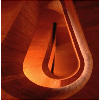
Jens Rubbert: Red Square 01